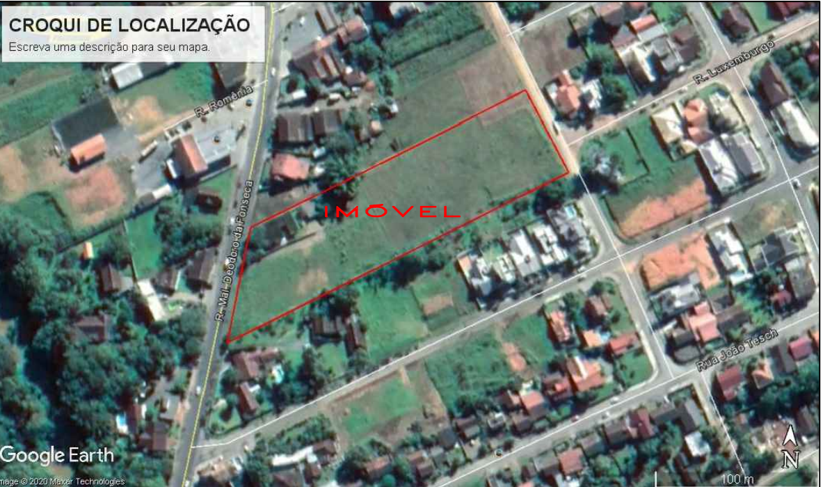
CROQUI DE LOCALIZAÇÃO IMAGEM GOOGLE EARTH